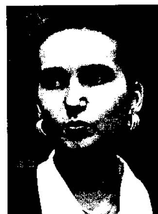
На фото (сверху вниз):